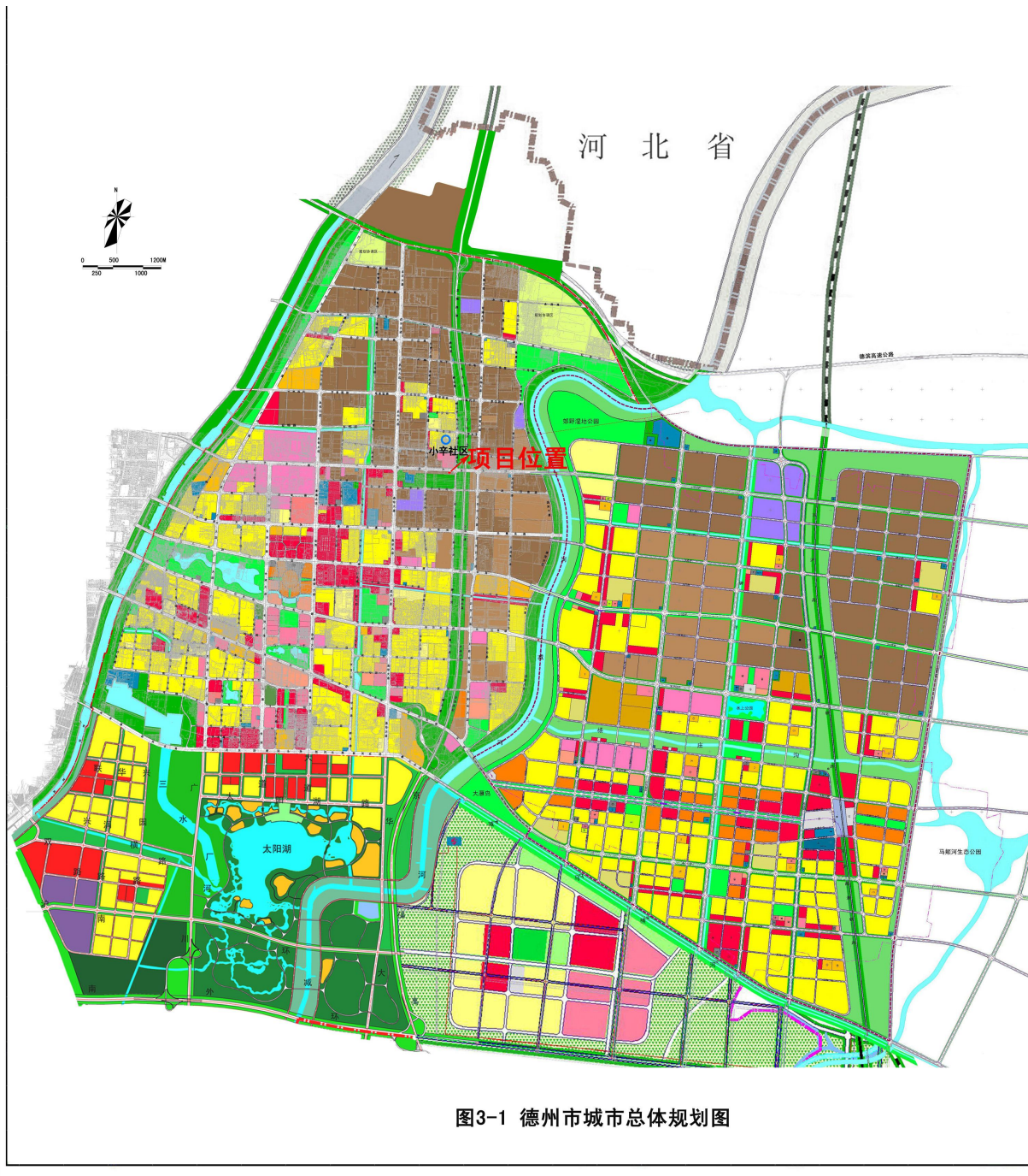
图3-1 德州市城市总体规划图