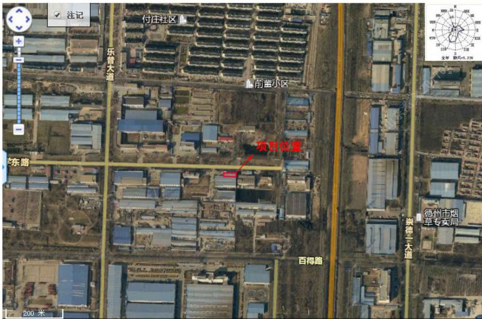
项目周围社会情况图